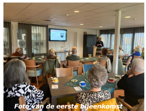
Foto van de eerste bijeenkomst